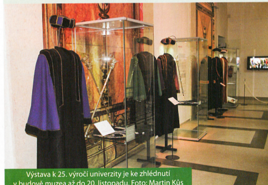
Výstava k 25. výročí univerzity je ke zhlédnutí v budově muzea až do 20. listopadu.